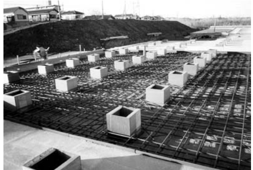
耐圧盤による入念な基礎工事が行われた光明寺墓苑

1999年に開設した埼玉県草加市にある「光明寺墓苑」では、もともと田んぼだった場所を用地として取得したため、地盤を改良する必要があり、墓地全域の基礎工事では上下2本の鉄筋を配するなど入念な施工を行い、強度に優れた耐圧盤を採用している（『月刊石材』2005年3月号16、17頁参照）。