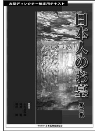
『日本人のお墓 第2集』 (社)日本石材産業協会

も「正しく使用されているか」ということになる。モルタルの練り方、また接着剤を使用する石面の状態（水分やホコリ、薬品などの有無）、その使用量、施工時間などである。