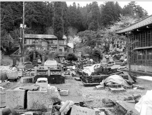
2005年4月22日の新潟県長岡市内にある 寺院墓地の様子