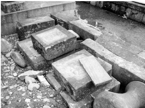
耐震対策が採られていなかった時代の墓石をどうするのか（新潟県中越地震の被災地にて）