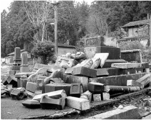
崩壊といえる状態。お墓参りの最中に地震が起きていたら…（新潟県中越地震の被災地にて編集部撮影）

墓石の地震対策に関するフォーラム、講演会などの場で情報を交換、共有することによって、社に あったよりよい施工、管理、対処法を見つけることができるであろう。また、全国団体に加入することで、情報だけでなく、万が一の時の援助、応援が得られることも認識すべきであろう。積極的に情報を入手し、ネットワークを構築することも重要だ。