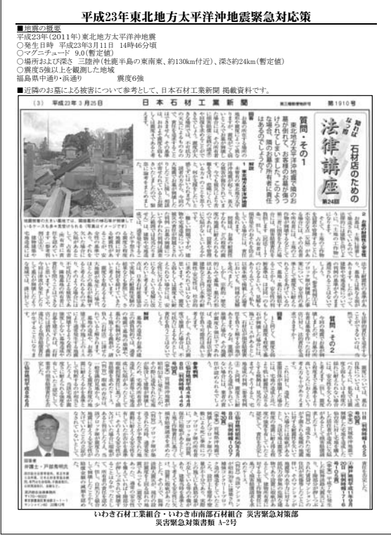
図3：墓石の被害相談について解説した日本石材工業新聞の切り抜き

の見解を述べたもの(地震の概要を一緒に掲載したものと、切り抜きだけのものがある)。実務的に最も多く相談が寄せられる問題であり、石材店としてその内容を確認しておくほか、寺院などに配布する=図3 掲示または配布用書類 災害緊急対策部がお墓に関する不安や相談に応じていること。 また、地震によって墓石が転倒したりバランスが崩れて、墓地が危険な状態であることや、悪質なセールスや詐欺まがいの営業に対する注意を墓参者などに呼びかけるもの(いずれも地震の概要や両組合員の連絡先などを掲載したHPのアドレス=QRコード付きが明記されており、前出の切り抜きを一緒に掲載したものと要点だけを記載したものがある)=図4 修復した墓石に対する免責事項の説明文とその同意書 巨大地震でお墓の基礎や地盤が脆弱(ぜいじやく)になってい場合、小さな余震でも転倒する可能性があることや、接着剤が完全硬化して実用強度を得るには数週間が必要なため、各店舗が定める保証規程の開始を施工後1カ月後からとする免責事項を説明したものとその同意書=図5 閉眼供養証明書