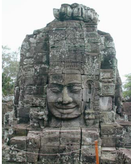
バイヨン寺院の四面像