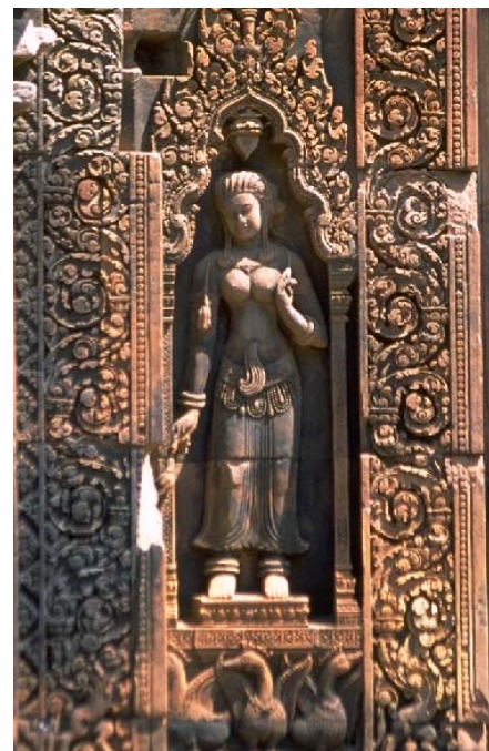
東洋のモナリザと評されるバンテアイスレイ遺跡