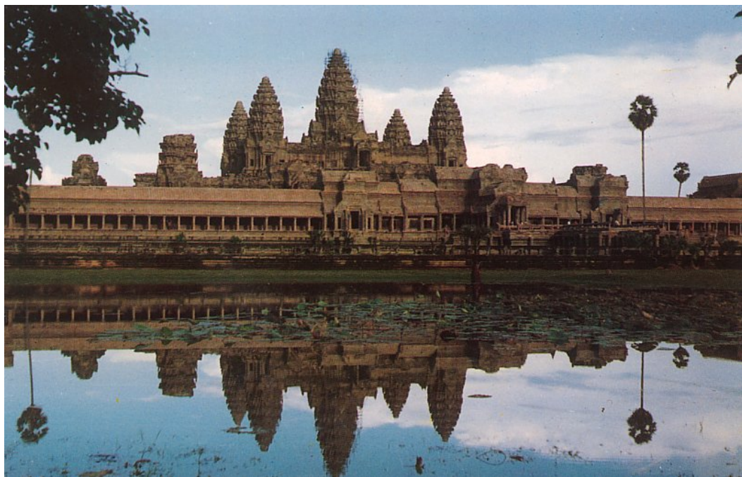
アンコール・ワット

※研修終了後、オプションでベトナム石材業者視察ツアーも可能です。詳細はお問い合わせ下さい。