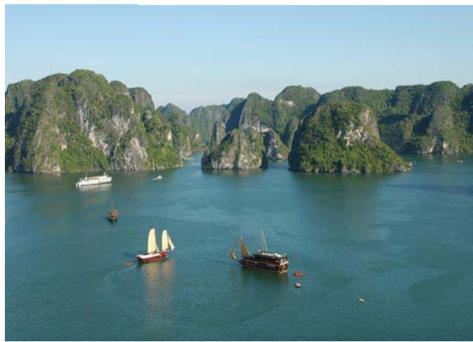
ベトナムの景勝地・海の桂林、ハロン湾