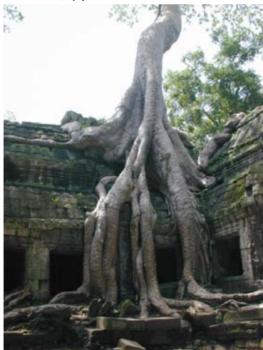
密林に覆われた、タ・プロム遺跡